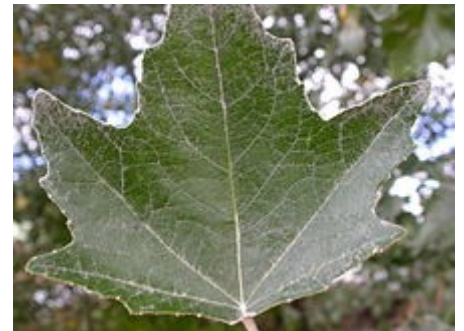
Detalle de la hoja