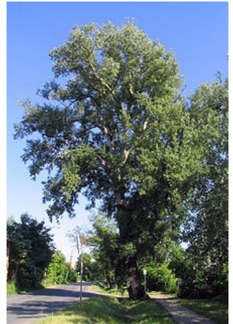
Vista de la planta